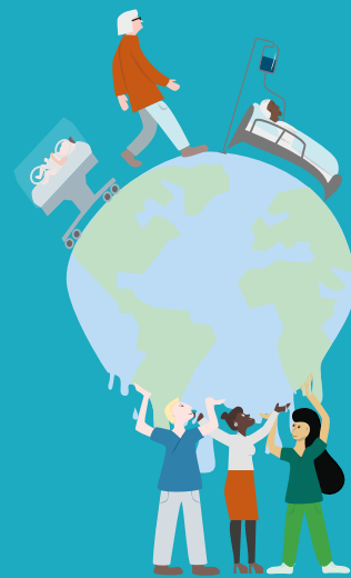
Illustration: Innovationsplattformen VGR

Hälso- och sjukvården står inför stora utmaningar. Befolkningen blir äldre samtidigt som antalet medarbetare i vården minskar. Det är en svår ekvation att få ihop när förväntningarna på en fortsatt utveckling och högre ambitionsnivå ökar. Samtidigt förändrar innovation och ny teknik samhället i snabb takt. Här finns en enorm potential också för hälso- och sjukvården att följa med. Genom att stärka förmågan till innovation kan vi möta framtidens behov. För att lyckas krävs ett nära samarbete mellan vården, patienter, akademi och näringsliv. Ny teknik och nya arbetssätt behöver utformas utifrån både patienternas och vårdens behov.